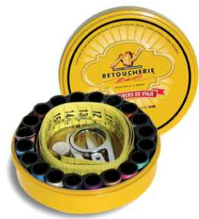
Imagen y marca

Retoucherie de Manuela® es una marca fuerte y consolidada en el mercado, líder absoluto en el sector de arreglos de ropa gracias a muchos años de experiencia.